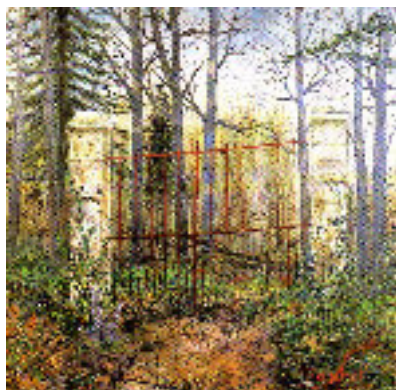
HP Troussicot : La grille des Coux www.artmajeur.com/hptroussicot